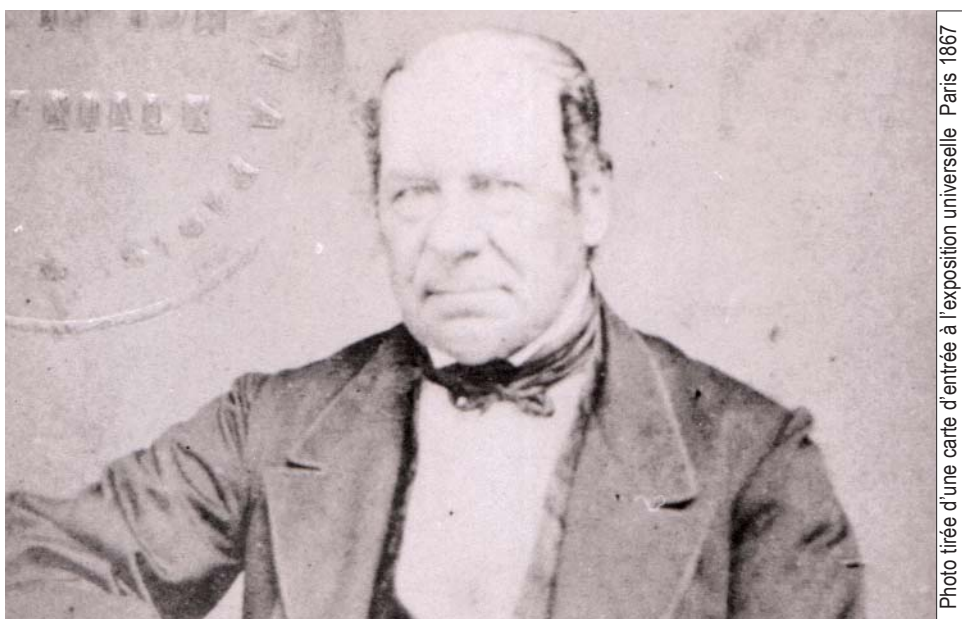
Photo tirée d'une carte d'entrée à l'exposition universelle Paris 1867